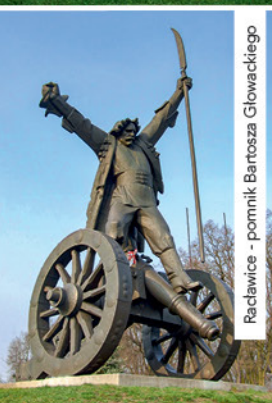
Raclawice - pomnik Bartosza Głowackiego