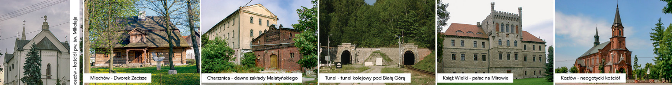
Słaboszów - kościół pw. św. Mikołaja