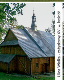
Ulinia Wielka - zabytkowy XVI w. kościół