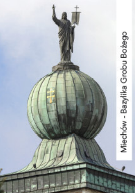
Miechów - Bazylika Grobu Bożego

Powiat miechowski położony w północnej części województwa małopolskiego zamieszkiwany jest przez 50500 osób i zajmuje powierzchnię 676 km 2 .